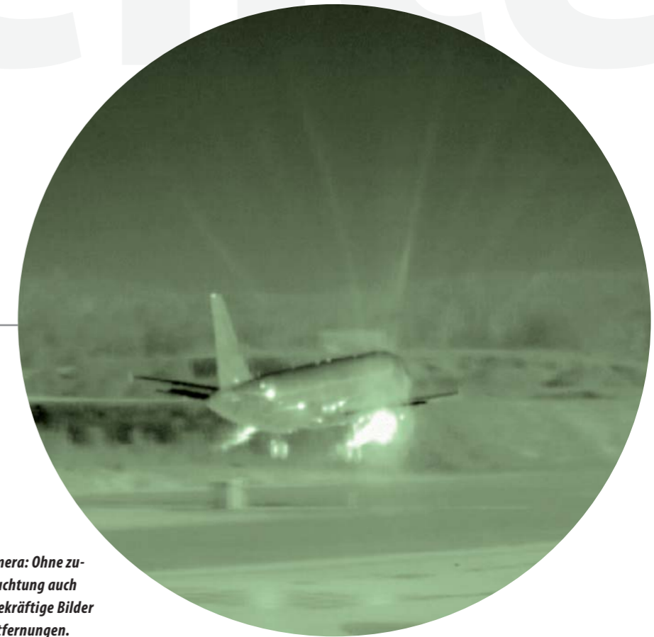
Wärmebildkamera: Ohne zusätzliche Beleuchtung auch nachts aussagekräftige Bilder über große Entfernungen.